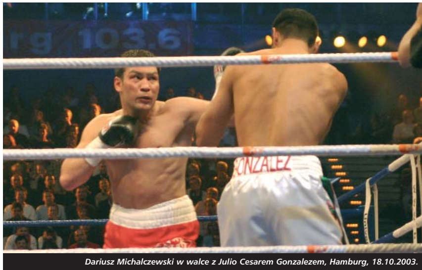
Dariusz Michalczewski w walce z Julio Cesarem Gonzalezem, Hamburg, 18.10.2003.