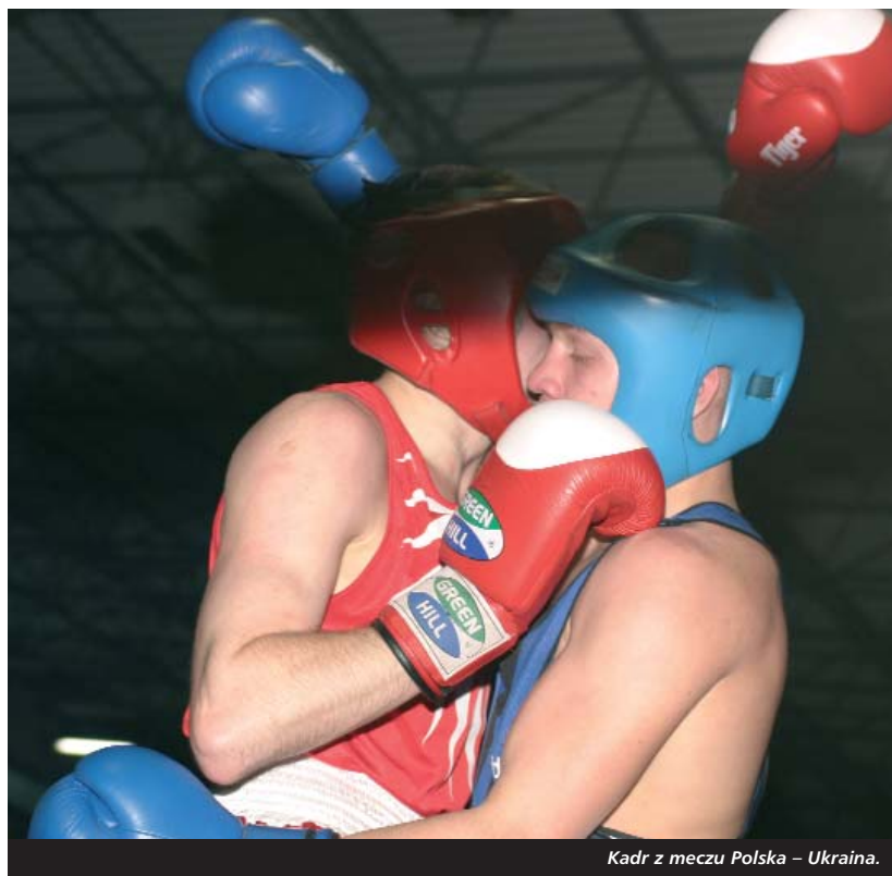
Kadr z meczu Polska – Ukraina.