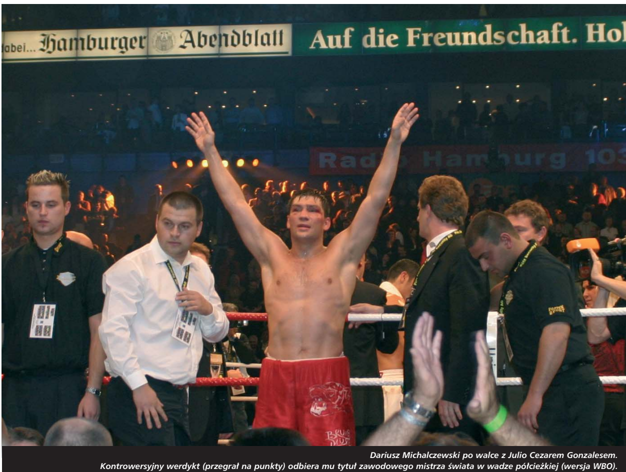
Dariusz Michalczewski po walce z Julio Cezarem Gonzalesem. Kontrowersyjny werdykt (przegrał na punkty) odbiera mu tytuł zawodowego mistrza świata w wadze półciężkiej (wersja WBO).