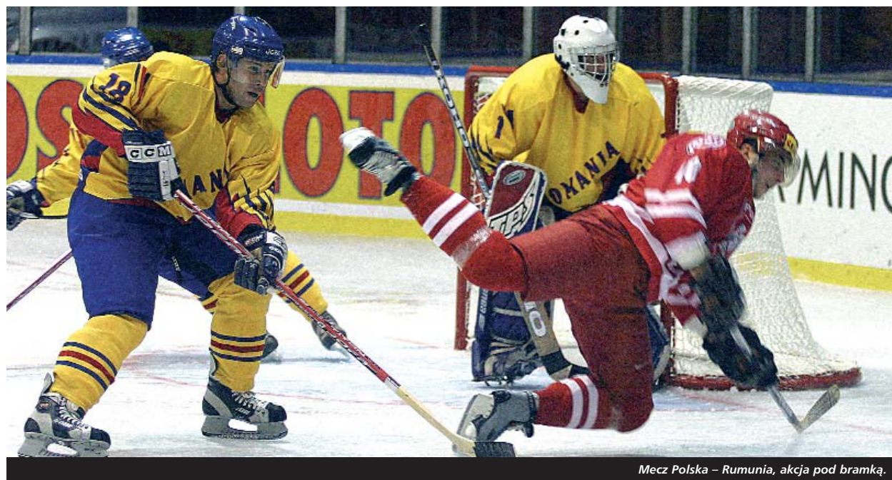
Mecz Polska – Rumunia, akcja pod bramką.