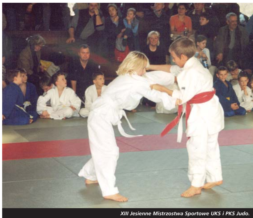
XIII Jesienne Mistrzostwa Sportowe UKS i PKS Judo.