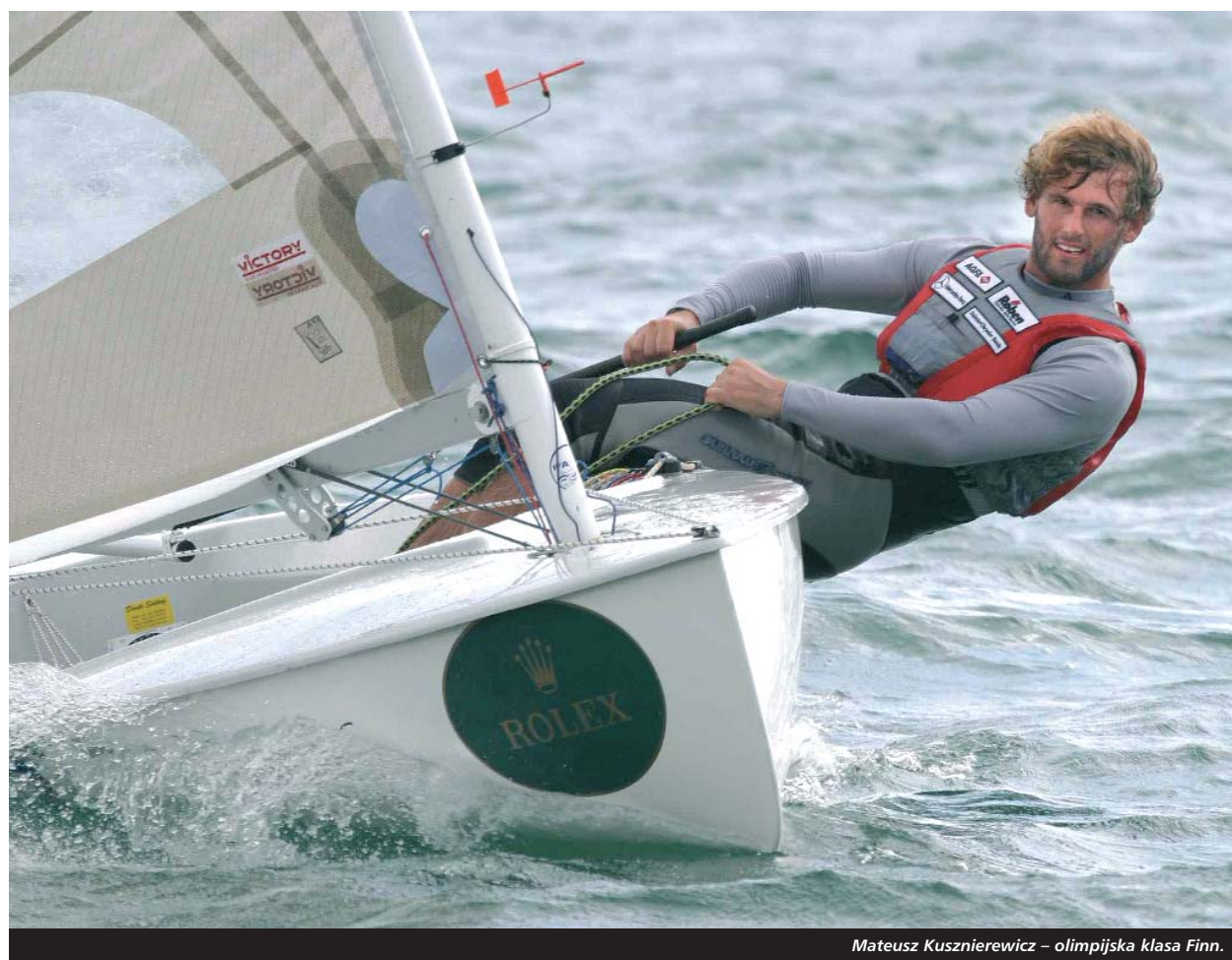
Mateusz Kusznierewicz – olimpijska klasa Finn.