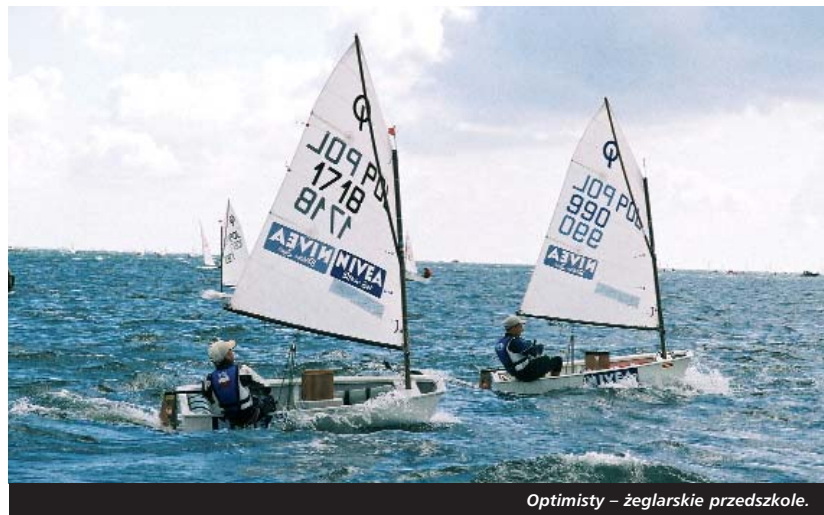
Optimisty – żeglarskie przedszkole.