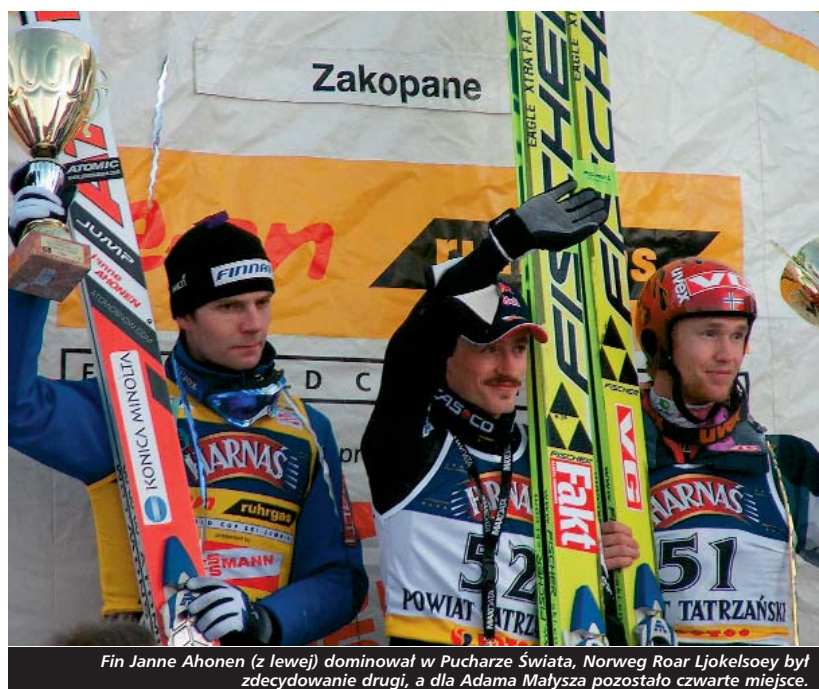
Fin Janne Ahonen (z lewej) dominował w Pucharze Świata, Norweg Roar Ljøkelsøy był zdecydowanie drugi, a dla Adama Małysza pozostało czwarte miejsce.