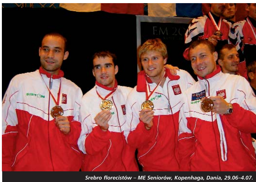
Srebro florecistów – ME Seniorów, Kopenhaga, Dania, 29.06-4.07.