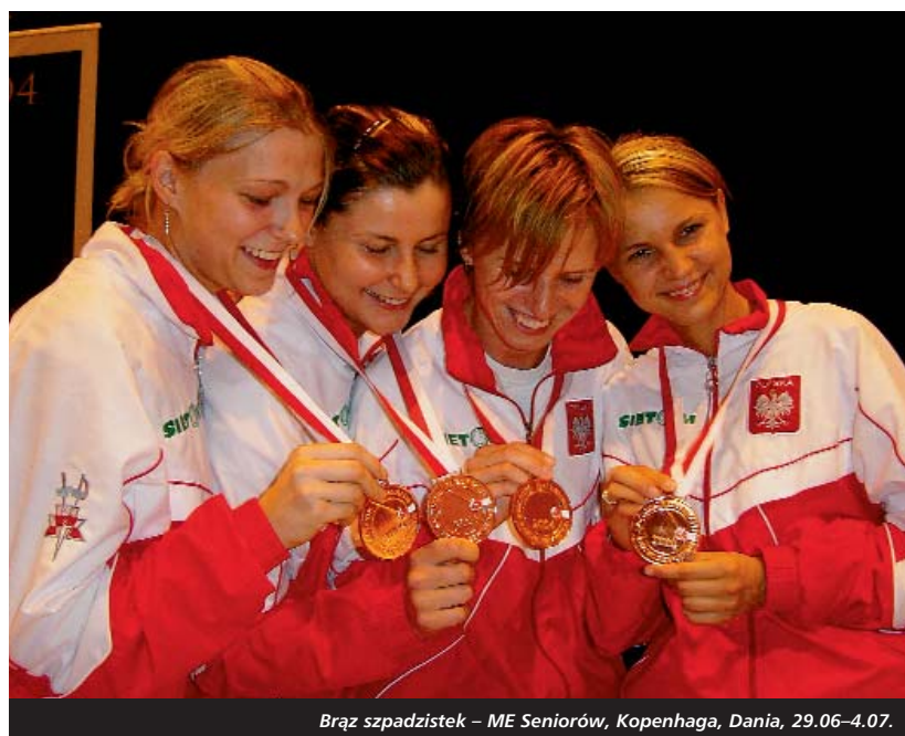
Brąz szpadzistek – ME Seniorów, Kopenhaga, Dania, 29.06–4.07.