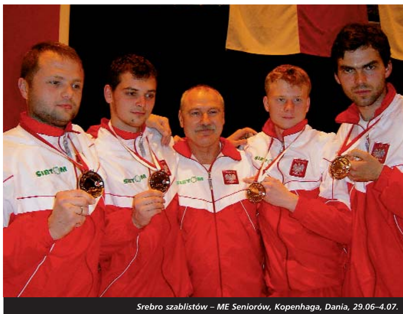
Srebro szablistów – ME Seniorów, Kopenhaga, Dania, 29.06–4.07.