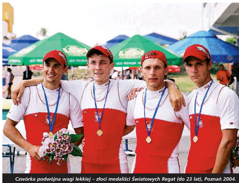
Czwórka podwójna wagi lekkiej – złoci medaliści Światowych Regat (do 23 lat), Poznań 2004.