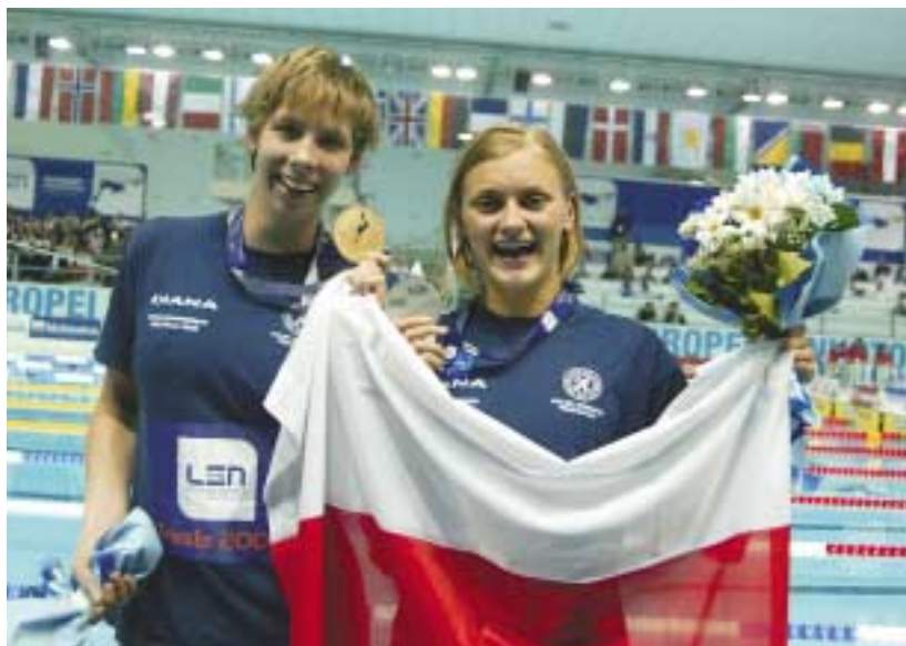
Katarzyna Baranowska – dwukrotna złota medalistka w konkurencji 200 i 400 m stylem zmiennym i Aleksandra Urbańczyk – srebrna medalistka na 200 m stylem zmiennym mistrzostw Europy, Triest, Włochy, 8–11.12.