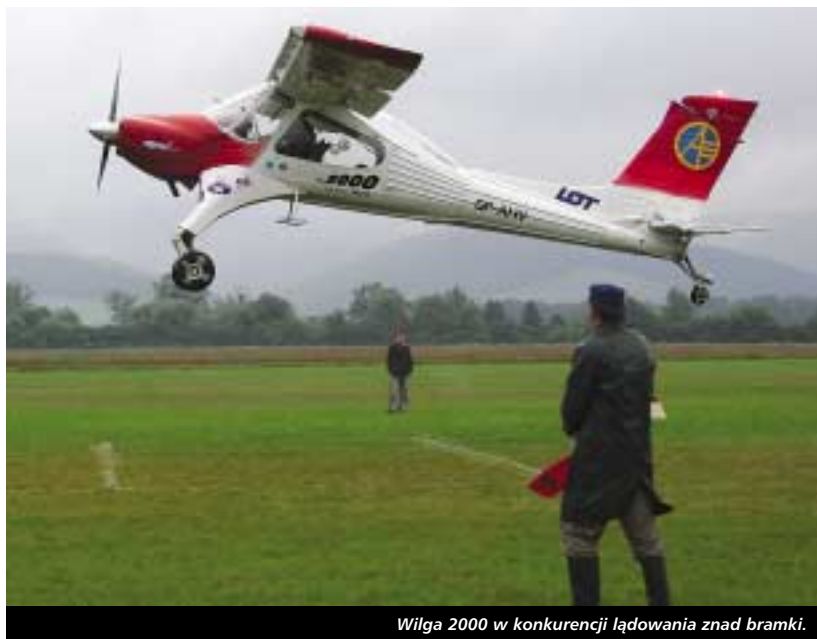
Wilga 2000 w konkurencji lądowania znad bramki.