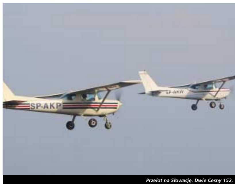
Przelet na Słowację. Dwie Cesny 152.