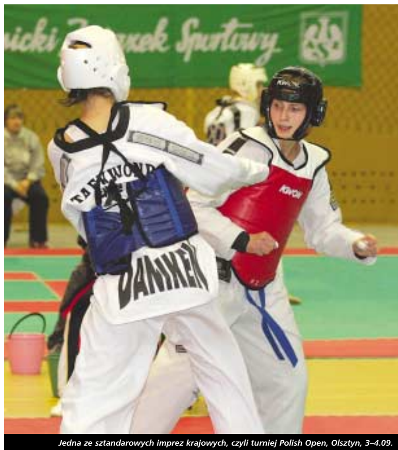
Jedną ze sztandarowych imprez krajowych, czyli turniej Polish Open, Olsztyn, 3-4.09.