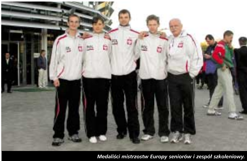
Medaliści mistrzostw Europy seniorów i zespół szkoleniowy.