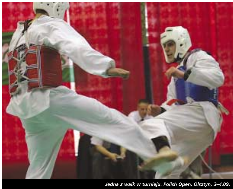
Jedna z walk w turnieju. Polish Open, Olsztyn, 3-4.09.