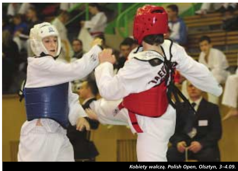
Kobiety walczą. Polish Open, Olsztyn, 3–4.09.