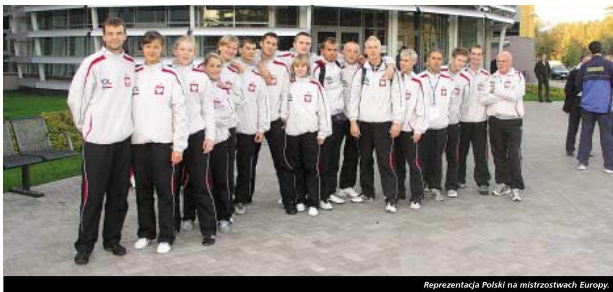
Reprezentacja Polski na mistrzostwach Europy.