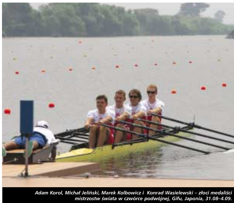
Adam Korol, Michał Jeliński, Marek Kolbowicz i Konrad Wasielewski – złoci medalści mistrzostw świata w czwórce podwójnej, Gifu, Japonia, 31.08-4.09.