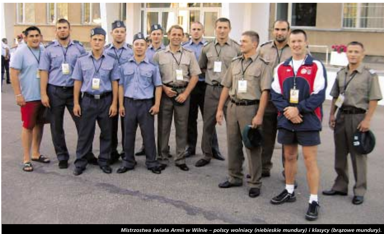
Mistrzostwa świata Armii w Wilnie – polscy wojnacy (niebieskie mundury) i klasycy (brązowe mundury).