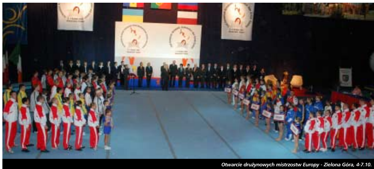
Otwarcie drużynowych mistrzostw Europy - Zielona Góra, 4-7.10.