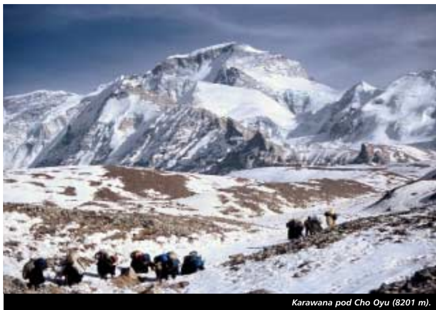
Karawana pod Cho Oyu (8201 m).

Trudny cel postawiła sobie również inna polska wyprawa, w skład której weszło tylko dwoje alpinistów: Anna Czerwińska i Jerzy Natkański. Makalu (8485 m) jest piątym co do wysokości szczytem świata, a trudnościami technicznymi ustępuje tylko K2. Anna Czerwińska w samotnym wypadzie i po wyczerpującym biwaku na wysokości 8250 m osiągnęła wierchołek Makalu jako pierwsza Polka i jedna z pierwszych kobiet na świecie. Zdobyła swój ósmy ośmiotysięcznik i plasuje się w czołówce kobiet pretendujących do zdobycia Korony Himalajów.