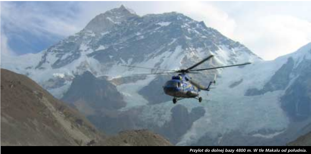
Przyłot do dolnej bazy 4800 m. W tle Makalu od południa.