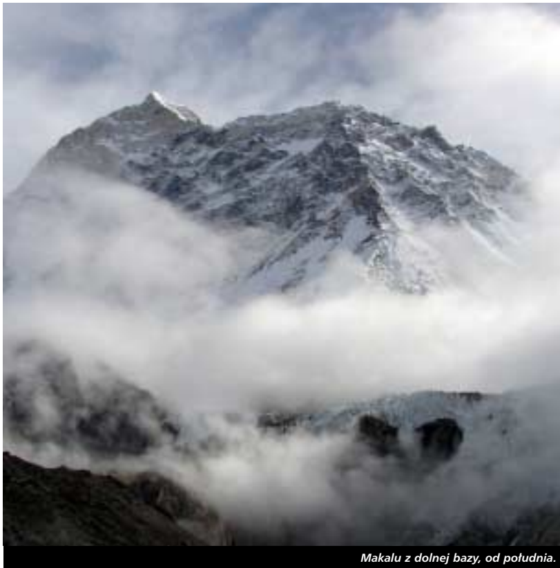
Makalu z dolnej bazy, od południa.