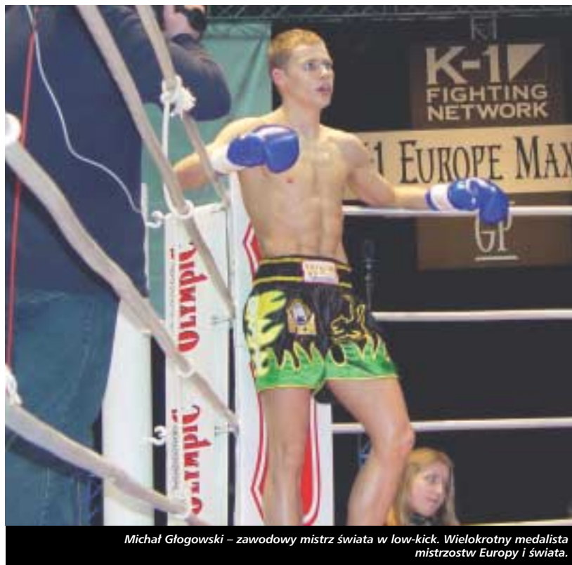
Michał Glogowski – zawodowy mistrz świata w low-kick. Wielokrotny medalista mistrzostw Europy i świata.