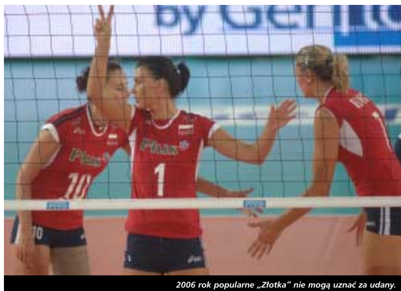
2006 rok popularne „Złotka” nie mogą uznać za udany.