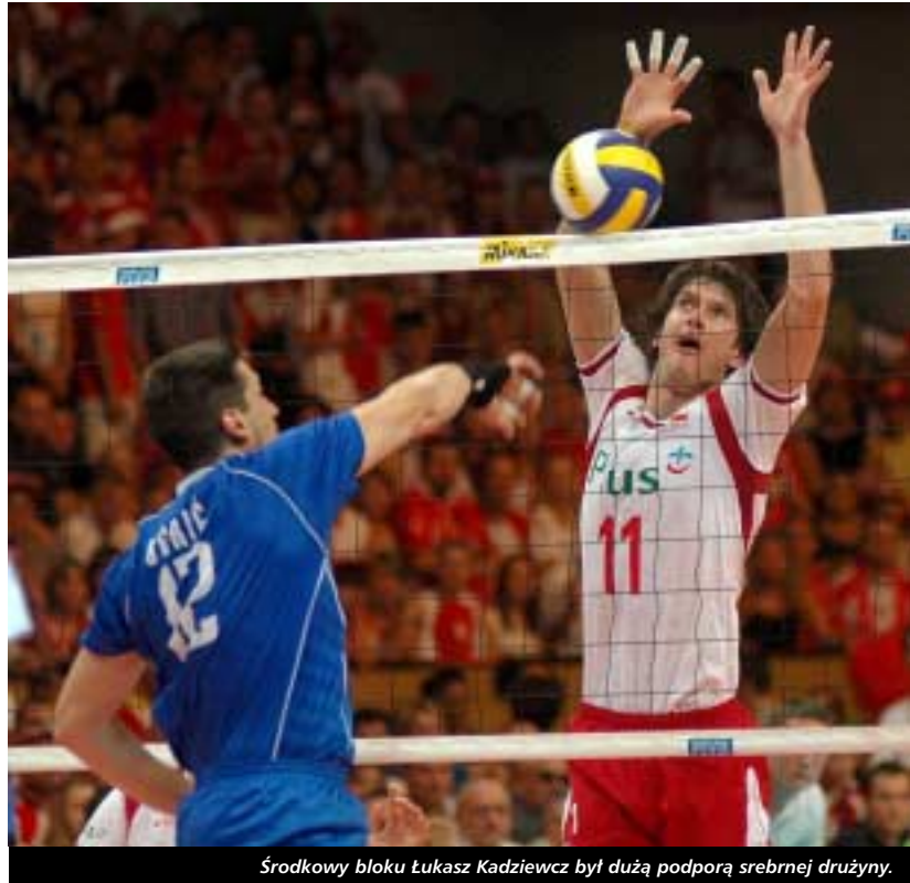
Środkowy bloku Łukasz Kadziewicz był dużą podporą srebrnej drużyny.

Skład Polski: Waldemar Kaczmarek, Bartosz Sufa, Mikołaj Sarnecki, Piotr Nowakowski, Ja- kub Jarosz, Mateusz Gorzewski, Bartosz Jane- czek, Bartosz Kurek, Krzysztof Antosik, Michał Kubiak, Arkadiusz Świechowski, Zbigniew Bartman, trener Zdzisław Gogol.