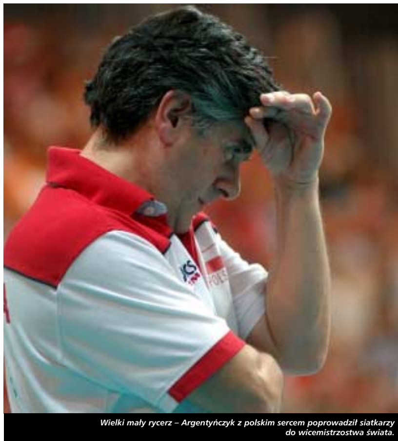
Wielki mały rycerz – Argentyńczyk z polskim sercem poprowadził siatkarzy do wicemistrzostwa świata.