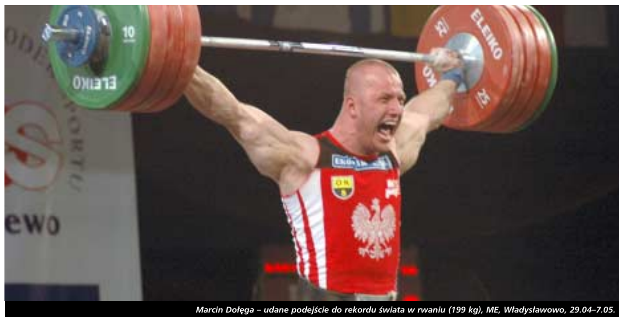
Marcin Dołęga – udane podejście do rekordu świata w rwaniu (199 kg), ME, Władysławowo, 29.04-7.05.