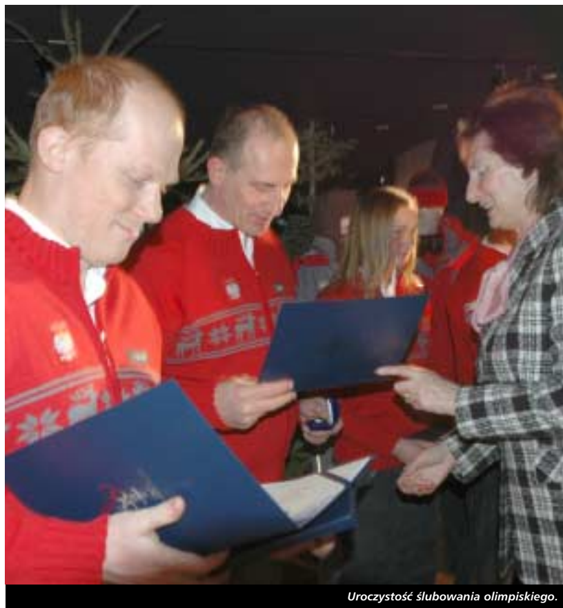
Uroczystość ślubowania olimpijskiego.