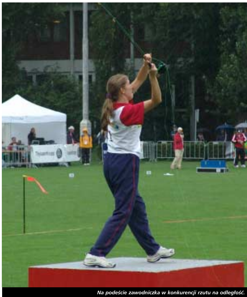
Na podeście zawodniczka w konkurencji rzutu na odległość.