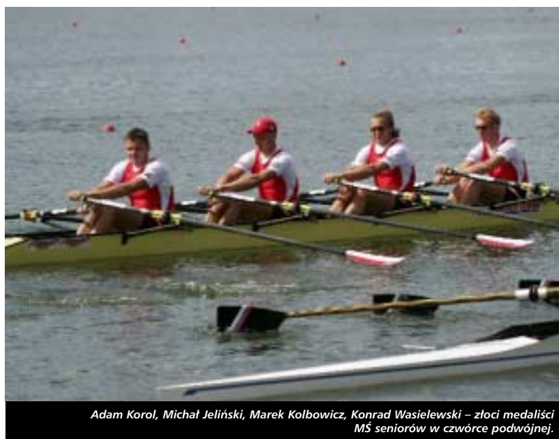
Adam Korol, Michał Jeliński, Marek Kolbowicz, Konrad Wasielewski – złoci medalści MŚ seniorów w czwórce podwójnej.