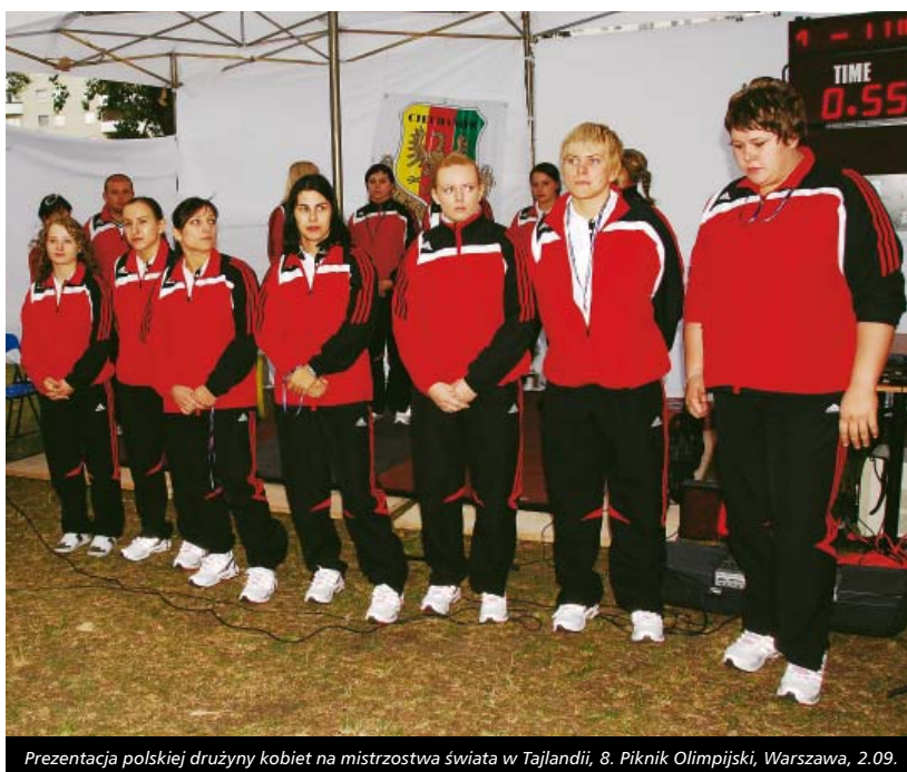
Prezentacja polskiej drużyny kobiet na mistrzostwa świata w Tajlandii, 8. Piknik Olimpijski, Warszawa, 2.09.