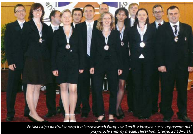
Polska ekipa na drużynowych mistrzostwach Europy w Grecji, z których nasze reprezentantki przywoziły srebrny medal, Heraklion, Grecja, 28.10–6.11.