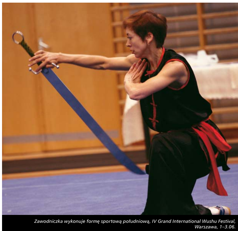
Zawodniczka wykonuje formę sportową południową, IV Grand International Wushu Festival, Warszawa, 1–3.06.