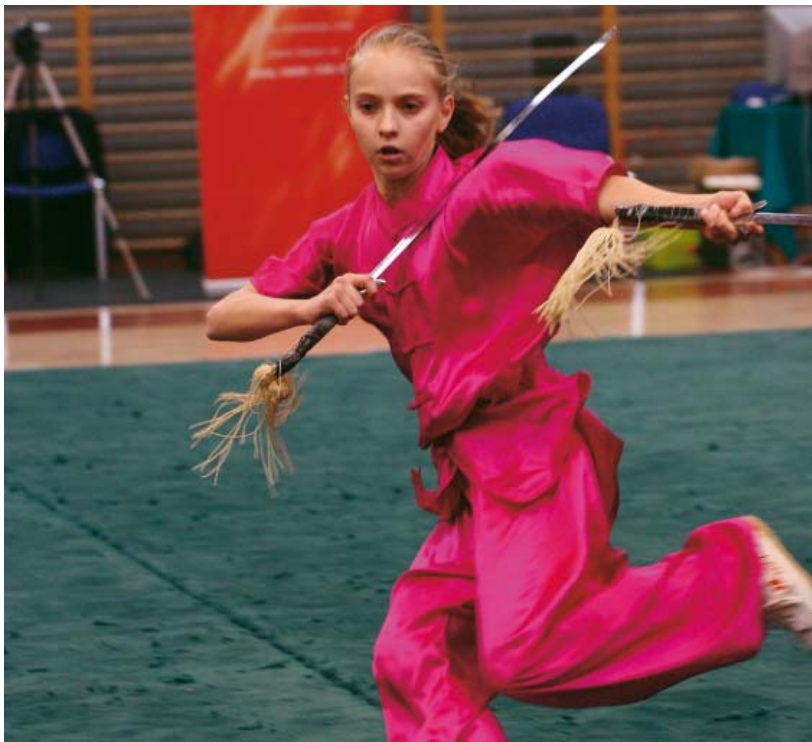
Zawodniczka wykonuje formę podwójnego miecza, IV Grand International Wushu Festival, Warszawa, 1-3.06.