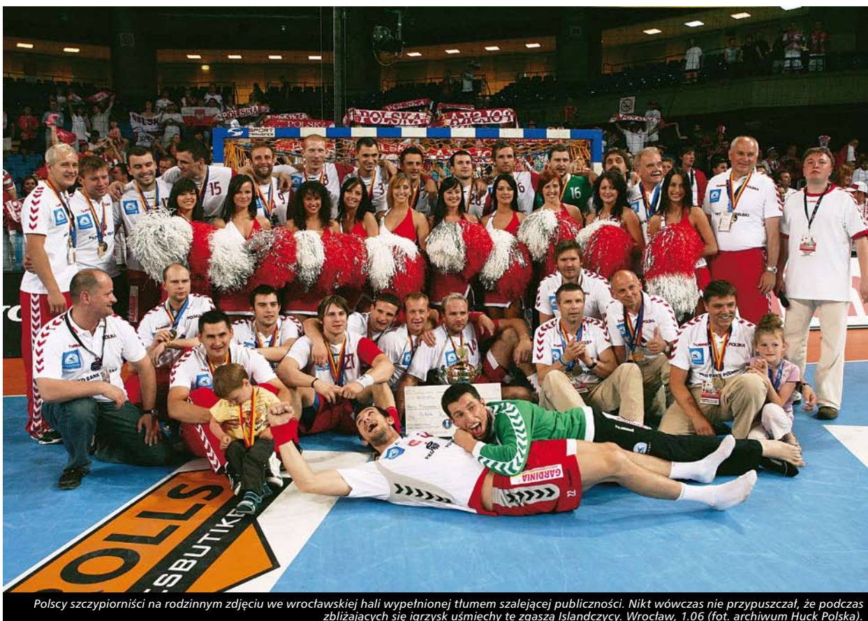
Polscy szczypiornicy na rodzinnym zdjęciu we wrocławskiej hali wypełnionej tłumem szalejącej publiczności. Nikt wówczas nie przypuszczał, że podczas zbliżających się igrzysk uśmiechy te zgaszą Islandczycy. Wrocław, 1.06.