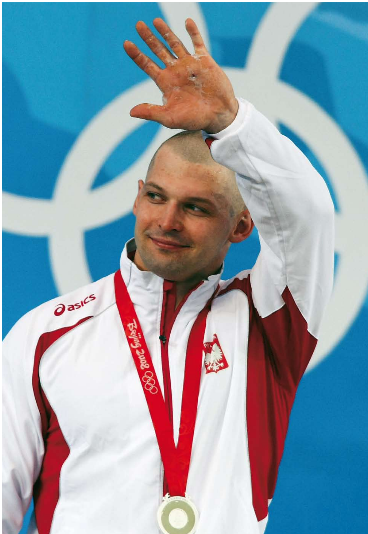
Szymon Kolecki powtórzył w Pekinie osiągnięcie z Sydney. Pomimo fatalnych rokowań związanych z poważną kontuzją kręgosłupa podjął z nią walkę i wygrał. W chińskiej stolicy zdobył drugie olimpijskie srebro w karierze, Pekin, 8–24.08.