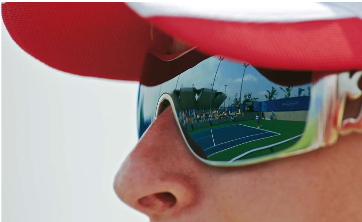
Agnieszka Radwańska trzeci rok z rzędu była naszą królową kortów. Tuż przed US Open została nawet dziewiątą rakiętą świata. Niestety występ w Pekinie nie był udany (tylko II runda), szczególnie że przed debiutem w igrzyskach prześlakowano nawet o medalu młodej Polki.

nie przywozła wprawdzie medalu ani nawet jednego zwycięstwa, ale... poznała tam nową sympatię. Domachowska i nasz najlepszy pływak Paweł Korzeniowski stworzyli drugą – obok florecistki Magdy Mroczkiewicz i siatkarka Łukasza Kadziewicza – olimpijską parę.